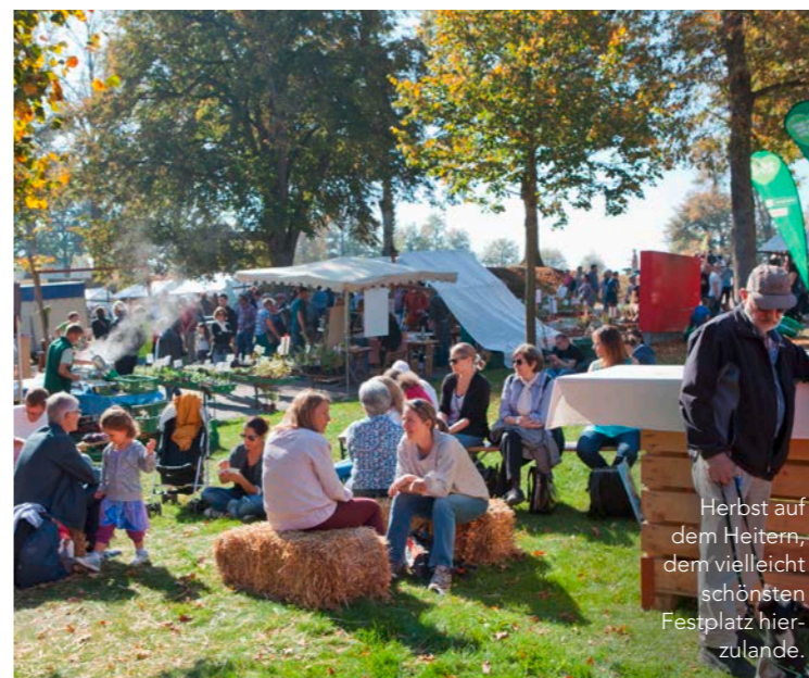
Herbst auf dem Heitern, dem vielleicht schönsten Festplatz hierzulande.