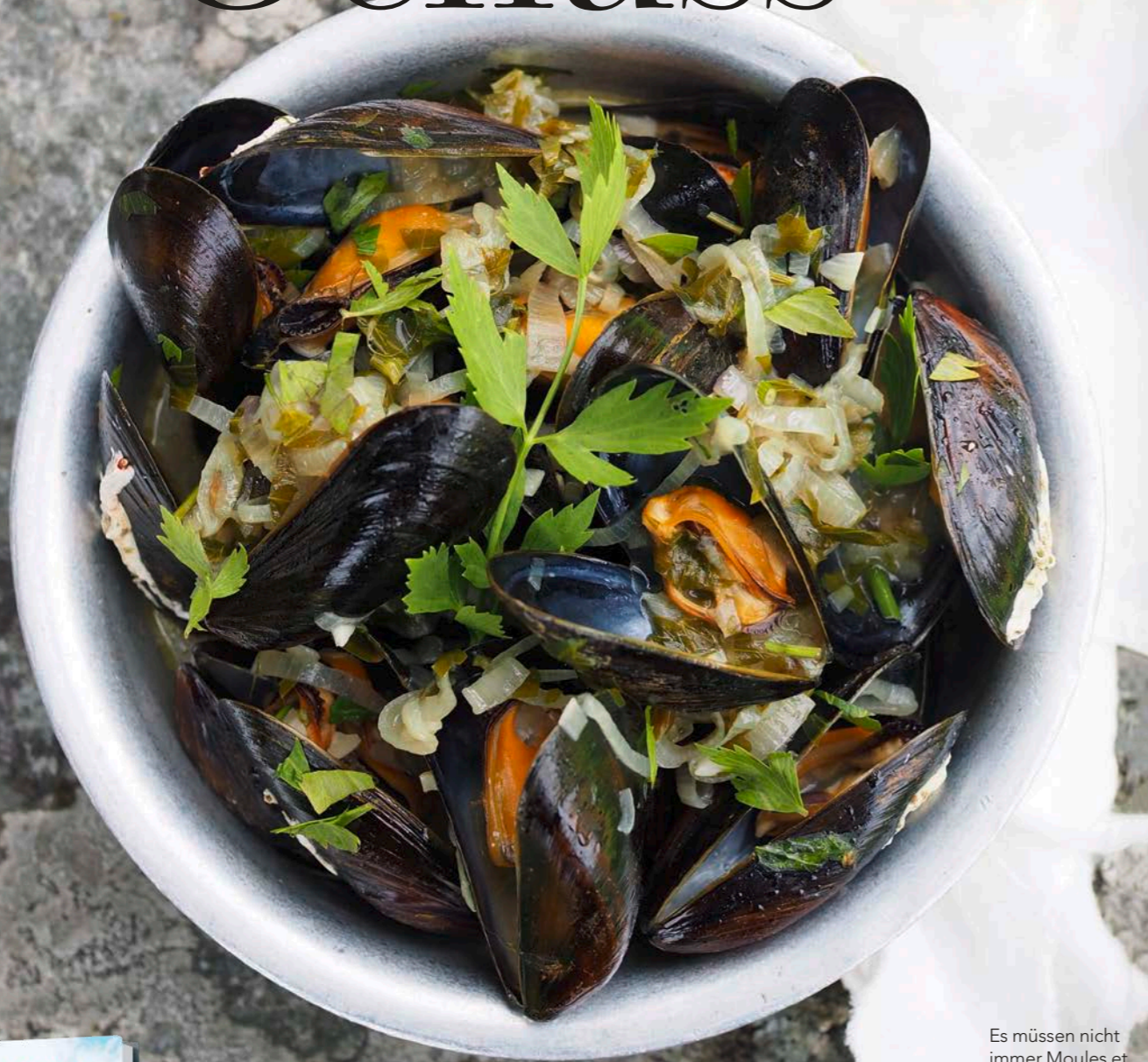
Es müssen nicht immer Moules et Frites mit Weisswein sein: Norweger kochen Muscheln in Bier.