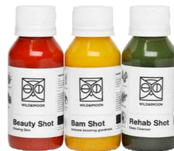
Wild & The Moon Saft-Survival-Kit aus drei Shots, ca. Fr. 18.–. wildandthemoon.fr

Die Mischung macht's – und bei den Produkten des französischen Brands Wild & The Moon auch die Zutaten. Alles bio – selbstverständlich. Die Rezepte werden zusammen mit Ernährungsspezialisten entwickelt, dabei entstehen: Säfte, Smoothies und Shots für den Energiekick.