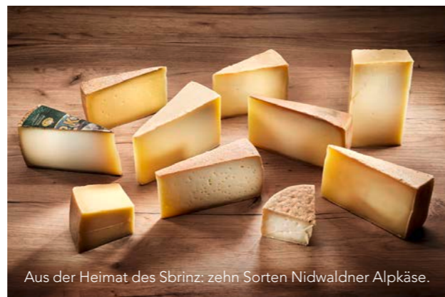
Aus der Heimat des Sbrinz: zehn Sorten Nidwaldner Alpkäse.

Nur die vor Ort verarbeitete Milch von Kühen, Geissen und Schafen, die ihre hunderttägigen Sommerferien auf einer Alp ab rund 1500 Metern verbracht haben, darf sich Alpkäse nennen. Das essbare Alpengold aller zehn kantonalen Alpkäsereien gibts am 16. und 17. November zu kosten und zu kaufen, vereint am Nidwaldner Alpchäsmärt im alten Schützenhaus in Beckenried. naturlichnidwalden.ch