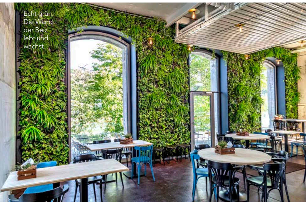
Echt grün: Die Wand der Beiz lebt und wächst.